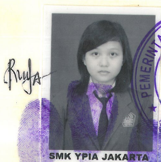
SMK UPIA JAKARTA