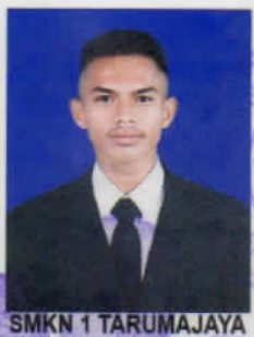
SMKN 1 TARUMAJAYA

dari sekolah menengah kejuruan setelah memenuhi seluruh kriteria sesuai dengan peraturan perundang-undangan.