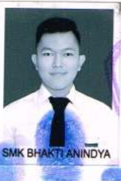
SMK BHAKTI ANINDYA

dari sekolah menengah kejuruan setelah memenuhi seluruh kriteria sesuai dengan peraturan perundang-undangan.