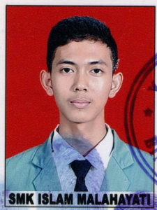
SMK ISLAM MALAHAYATI

dari sekolah menengah kejuruan setelah memenuhi seluruh kriteria sesuai dengan peraturan perundang-undangan.