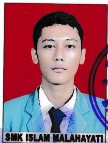
SMK ISLAM MALAHAYATI

dari sekolah menengah kejuruan setelah memenuhi seluruh kriteria sesuai dengan peraturan perundang-undangan.