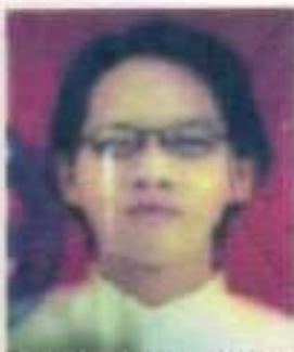
Drs. H. A. MUHAIMIN ISKANDAR, M.Si

MENTERI TENAGA KERJA DAN TRANSMIGRASI REPUBLIK INDONESIA