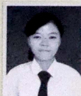
SMK BHAKTI ANINDYA