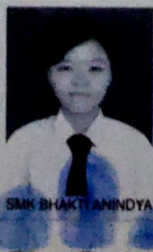
SMK BHAKTI ANINDYA

dari sekolah menengah kejuruan setelah memenuhi seluruh kriteria sesuai dengan peraturan perundang-undangan.