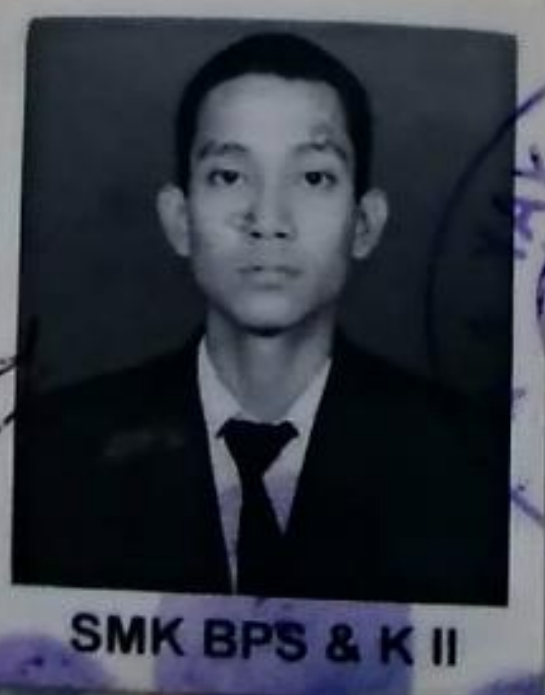
SMK BPS & K II