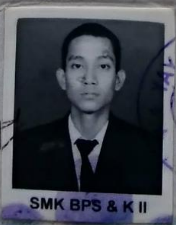
SMK BPS & K II