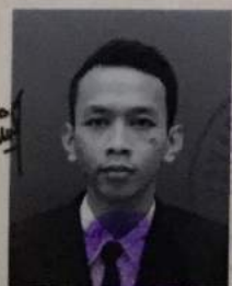
SMK PERGURUAN CIKINI

dari satuan pendidikan berdasarkan hasil Ujian Nasional dan Ujian Sekolah serta telah memenuhi seluruh kriteria sesuai dengan peraturan perundang-undangan.