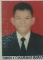
SMKN 1 CIKARANG BARAT