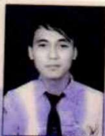
SMA N 1 TARUMAJAYA