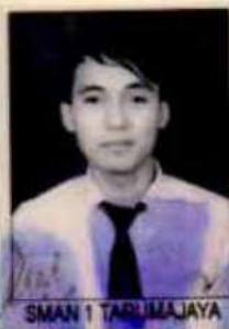
SMAN 1 TARUMAJAYA

dari satuan pendidikan berdasarkan hasil Ujian Nasional dan Ujian Sekolah serta telah memenuhi seluruh kriteria sesuai dengan peraturan perundang-undangan.