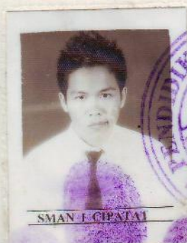
SMAN 1 CIPATAT