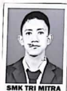
SMK TRI MITRA