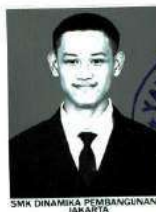
SMK DINAMIKA PEMBANGUNAN 1 JAKARTA