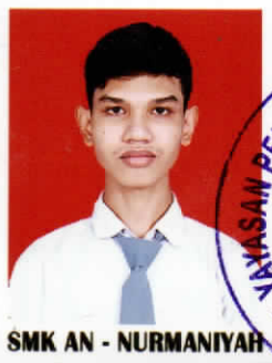
SMK AN - NURMANIYAH

Demikian Surat Keterangan ini diberikan agar dapat dipergunakan sebagaimana mestinya.