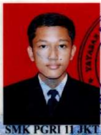
SMK PGRI 11 JKT

dari sekolah menengah kejuruan setelah memenuhi seluruh kriteria sesuai dengan peraturan perundang-undangan.