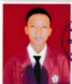
SMK IMTAQ DARURRAHIM

dari sekolah menengah kejuruan pada tanggal 2 Mei 2020, setelah memenuhi seluruh kriteria sesuai dengan peraturan perundang-undangan.