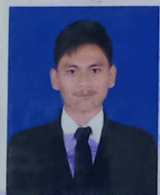
SMKN 1 TARUMAJAYA

dari sekolah menengah kejuruan setelah memenuhi seluruh kriteria sesuai dengan peraturan perundang-undangan.