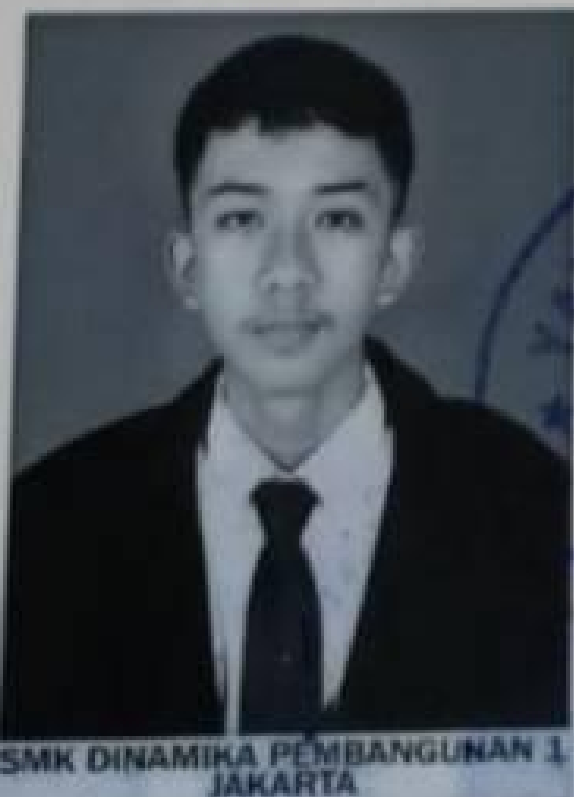
SMK DINAMIKA PEMBANGUNAN 1 JAKARTA

dari sekolah menengah kejuruan setelah memenuhi seluruh kriteria sesuai dengan peraturan perundang-undangan.