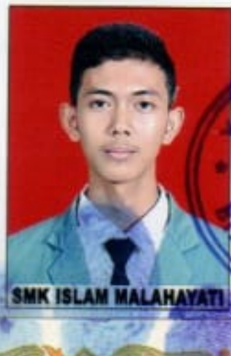
SMK ISLAM MALAHAYATI

dari sekolah menengah kejuruan setelah memenuhi seluruh kriteria sesuai dengan peraturan perundang-undangan.