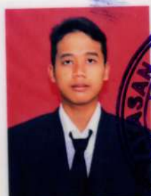
SMK PATRIOT 1 BEKASI

dari sekolah menengah kejuruan setelah memenuhi seluruh kriteria sesuai dengan peraturan perundang-undangan.