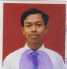
SMAN 1 TARUMAJAYA BEKASI