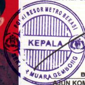
BAGUS SUSANTO, S.H