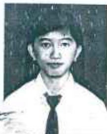
SMA NEGERI 23 JAKARTA

1) Nilai Akhir = 40% Nilai Sekolah + 60% Nilai Ujian Nasional